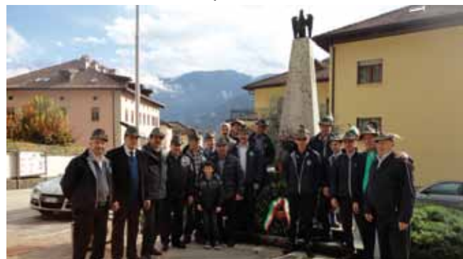
Attività svolte dagli Alpini nel 2013

Il Gruppo Alpini organizza annualmente l'Assemblea dei soci, numerose manifestazioni Alpine, cerimonie in memoria dei Caduti, feste campestri (in località Pianizia), riunioni conviviali e ricreative. Per l'occasione elenchiamo di seguito le principali celebrazioni e ricorrenze paesane: